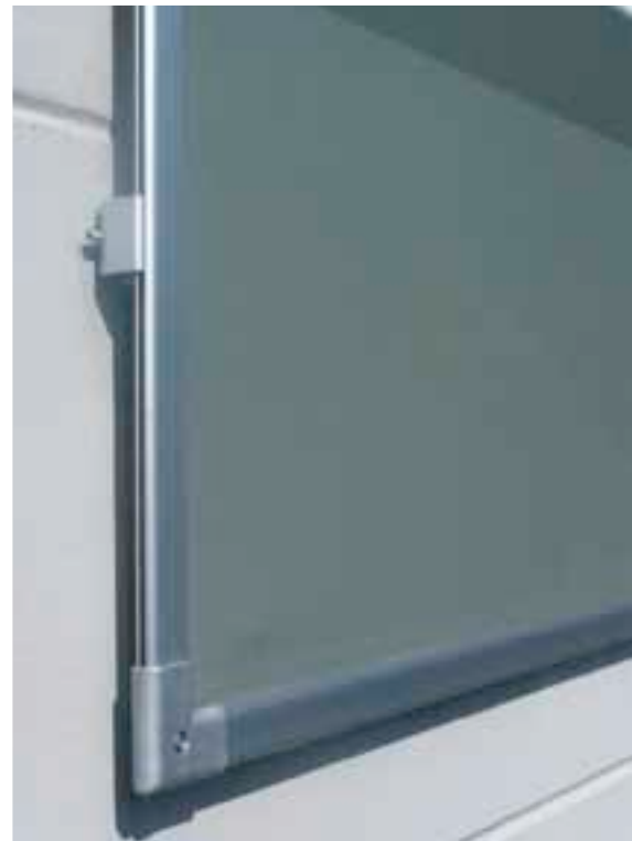
Rahmensystem 2-Kanal FLACH / Frame system 2-channel FLAT