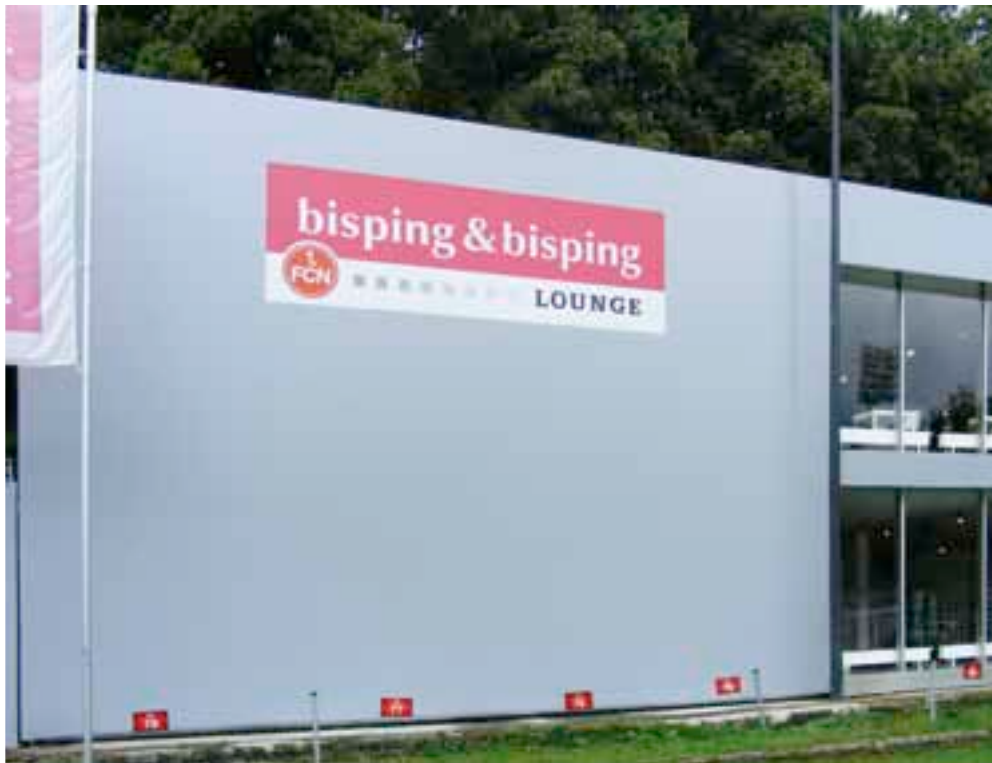
Gebäudeverkleidung mit Schiene VERDECKT / Covering of building with Rail COVERED