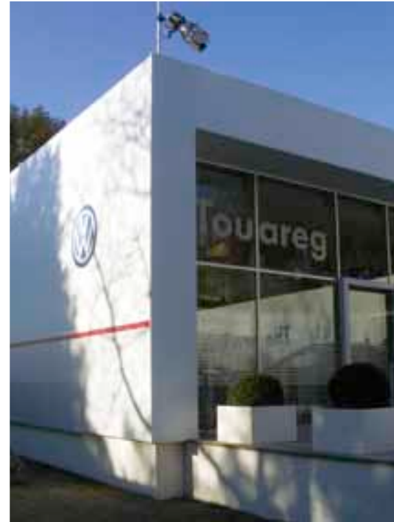
Applikation mit Schiene 2-Kanal VERDECKT / Application with rail 2-channel COVERED