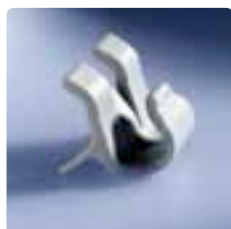
22.0826.45 ECO-FRAME Kunststoffclip für Schiene 4-Kanal RUND für 8 mm Expanderseil