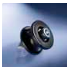
22.5732.43 ECO-FRAME Rundknopf für Schiene 4-Kanal RUND mit Konterstück