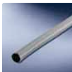
06.2008.71 Expanderseil 8 mm grau